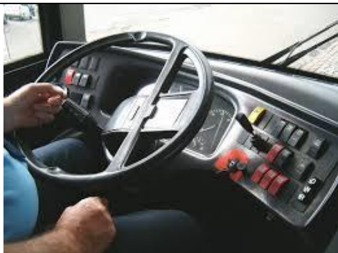
Żeby zatrąbić potrzebny jest klakson – horn (czyt. horn)