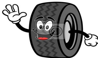
Posiada koła – wheels (czyt. lils)