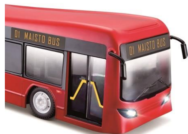
Wchodzimy drzwiami – door (czyt. dor)