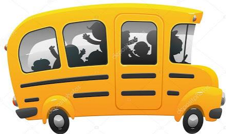
To jest autobus – bus ( czyt. bas)

W pierwszej kolejności wyjaśnię Wam słówka, które pojawią się w piosence.