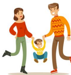
Jadą z nim mama i tata – mommy (czyt. mami), daddy (czyt. dadi)