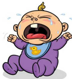
Pasażerem będzie też bobas – baby (czyt. bejbi)