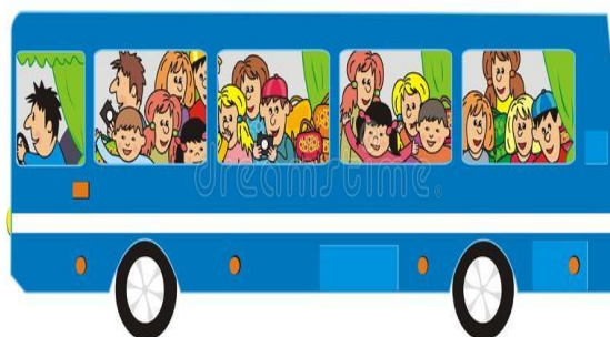
W autobusie podróżują ludzie – people (czyt. pipul)