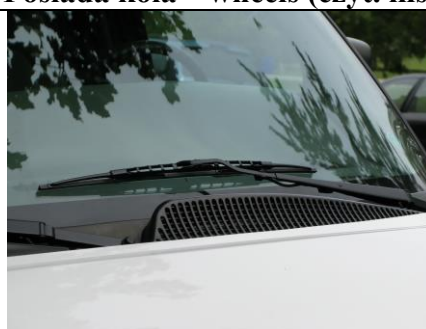
Gdy pada są włączone wycieraczki – wipers (czyt. łajpers)