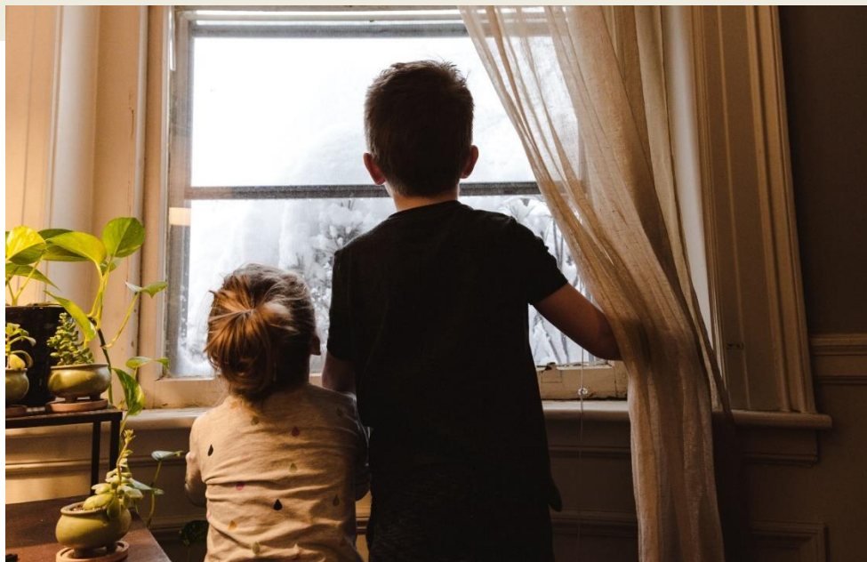
Dzieci znalazły się z dnia na dzień w całkiem innej rzeczywistości...